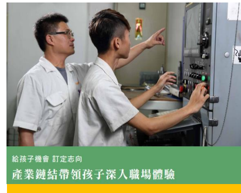
給孩子機會 訂定志向 產業鏈結帶領孩子深入職場體驗