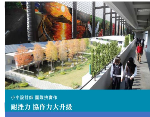
小小設計師 團隊拼實作 耐挫力 協作力大升級