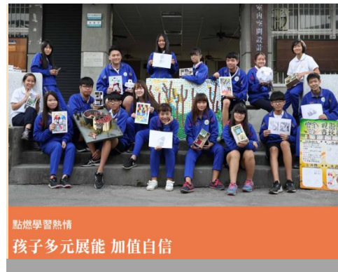
點燃學習熱情 孩子多元展能 加值自信