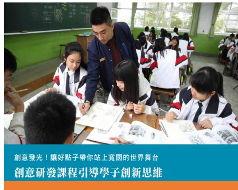
創意發光！讓好點子帶你站上寬闊的世界舞台 創意研發課程引導學子創新思維