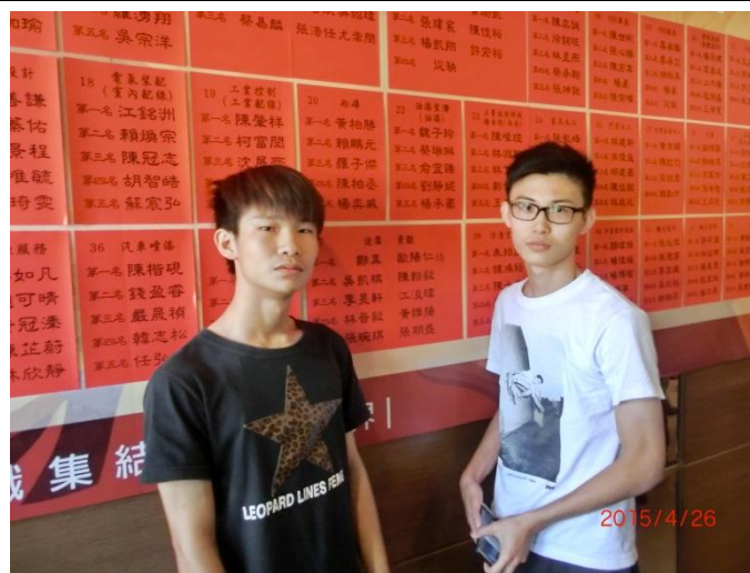
(照片 2 說明) 榮獲全國技能競賽造園景觀職類中區賽第一名