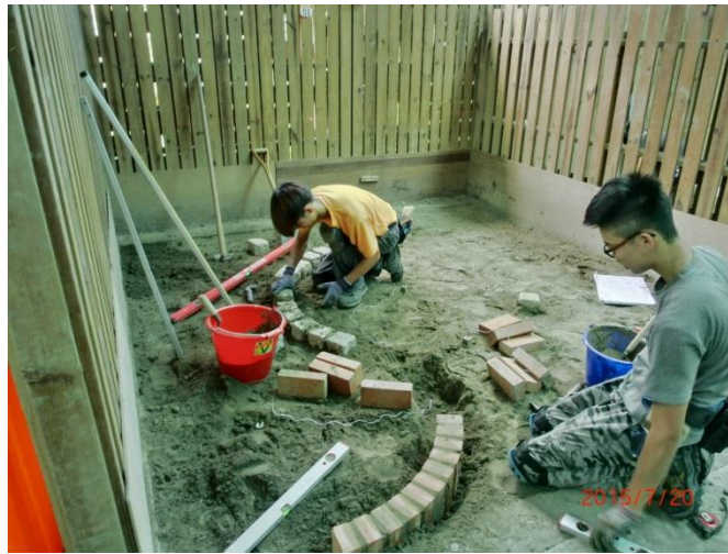
(照片 1 說明) 辛苦的在勞動署中彰投分署進行移地訓練